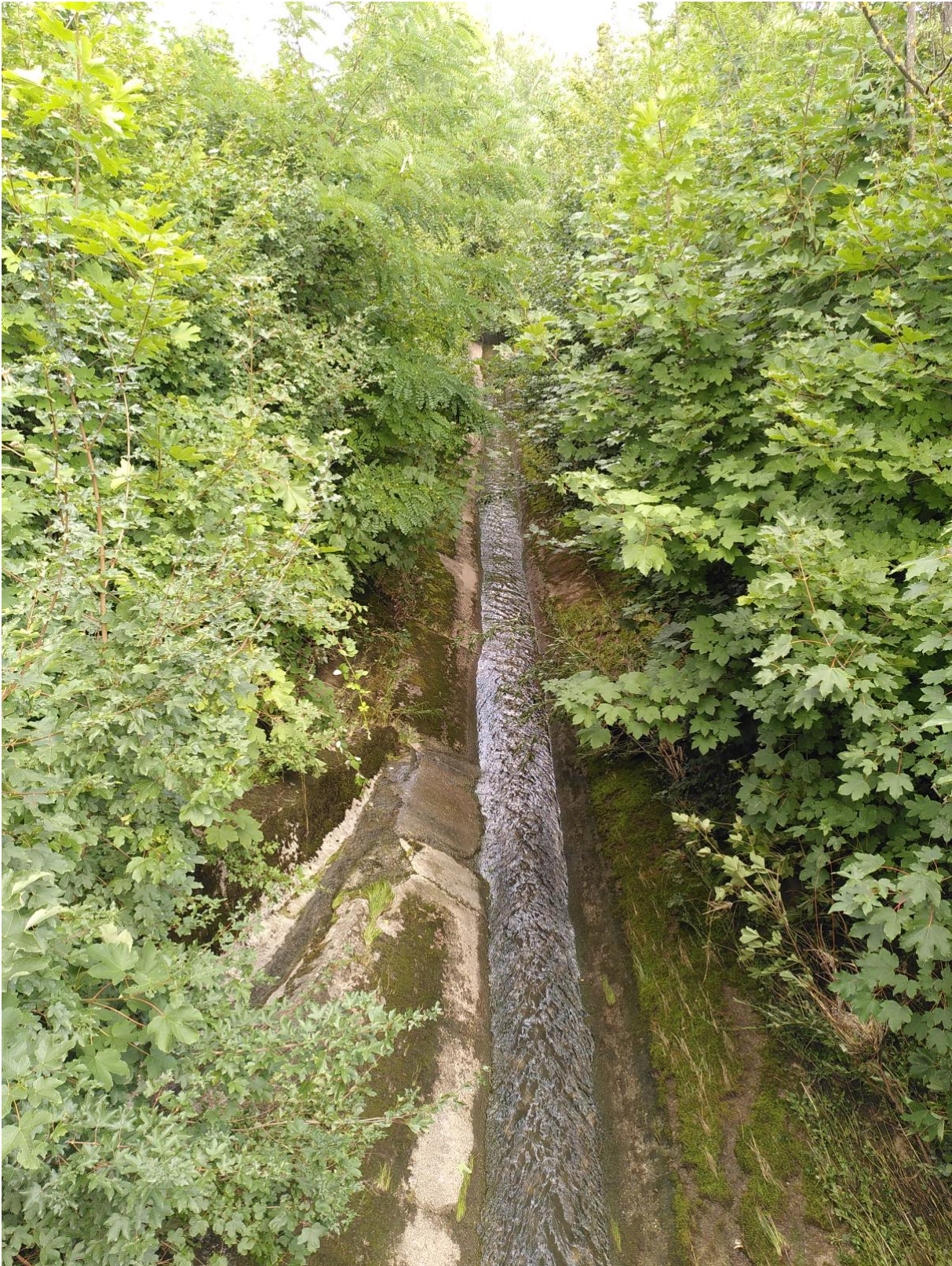
Bild eines kanalisiertem Abschnitts des Feuerbachs auf Zuffenhauser Gemarkung